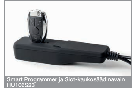
Smart Programmer ja Slot-kaukosäädinavain HU106S23

Smart Pro opastaa sinua vaihe vaiheelta ohjelmointiprosessin läpi. Voit lukea tietoja joko OBD-kaapelista, joka on aina kytketty ajoneuvoon ohjelmoinnin aikana, tai virtalukosta avainemulaattorilla.