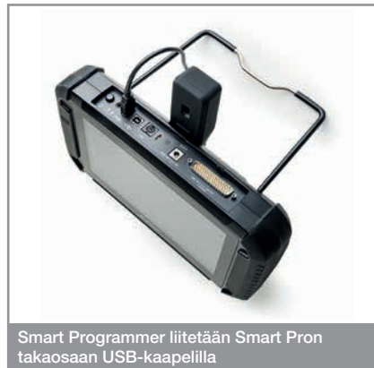
Smart Programmer liitetään Smart Pron takaosaan USB-kaapelilla

Kaikki laitteet valmistetaan CE-standardien mukaisesti. Laadun ja luotettavuuden varmistamiseksi.